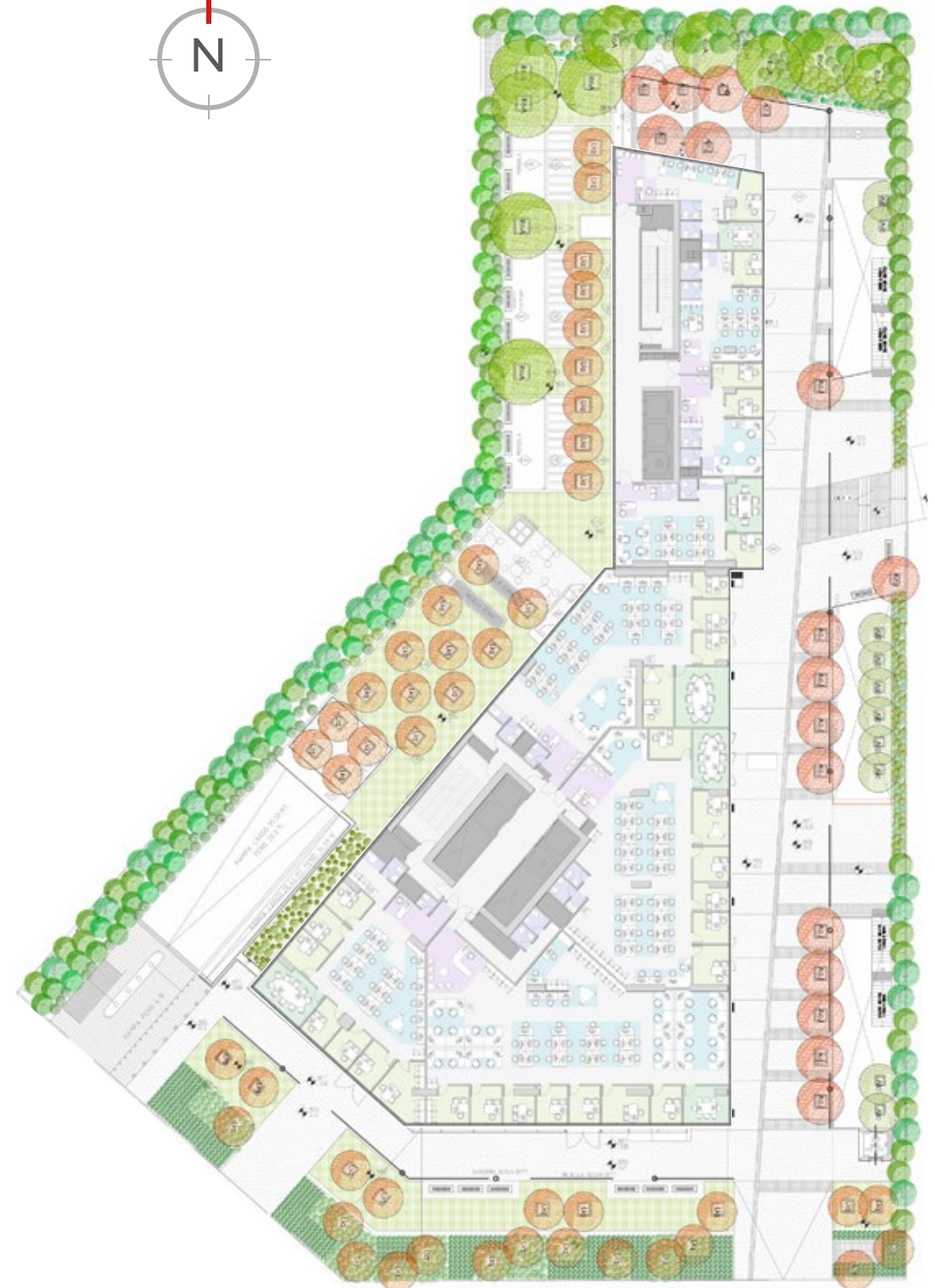
Piso Tipo / Estudio de cabida con densidad 10 m 2 / persona