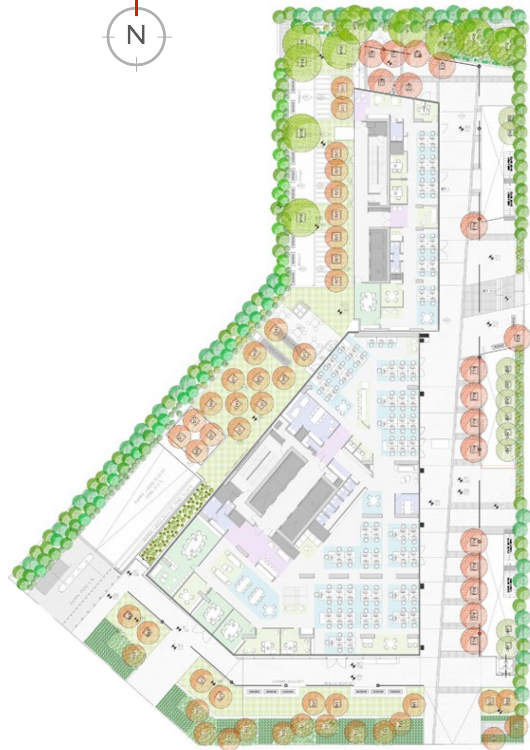
Piso Tipo / Estudio de cabida con densidad 10 m 2 / persona